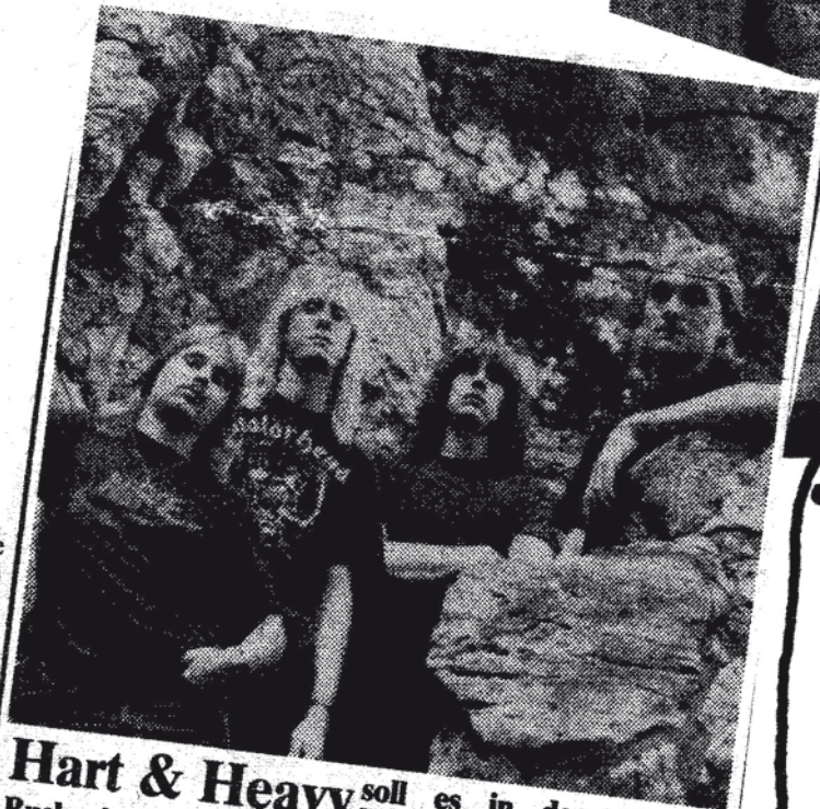
Hart & Heavy soll es in der „Heavy-Nacht“ im „Rock-o-la“ am 20.30 Uhr drei Duisburger Bands der härteren Gangart für Schwermetal-Töne sorgen wollen. Mit von der Rocknacht-Partie sind die Gruppen „Dorian Gray“, „Sanctified Reasons“ un „Carpe Diem“ (Foto).

Im Mai '92 er- scheint die EP "böses aus dem Bunker" mit Carpe Diem - Bloods of Money - Walk Yourself